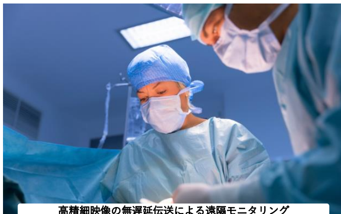
高精細映像の無遅延伝送による遠隔モニタリング