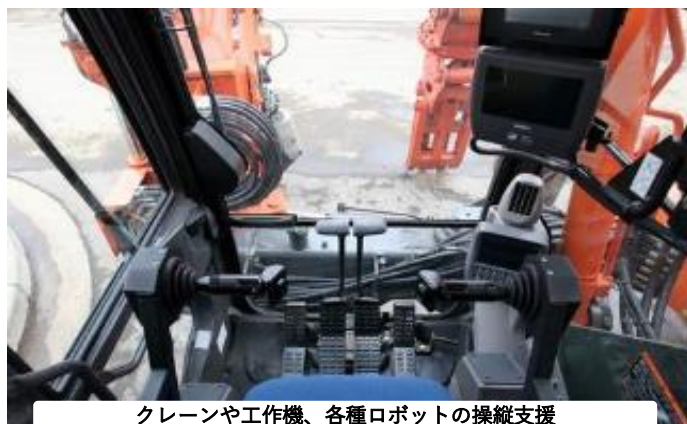
クレーンや工作機、各種ロボットの操縦支援