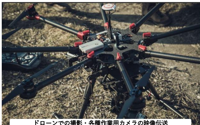
ドローンでの撮影・各種作業用カメラの映像伝送