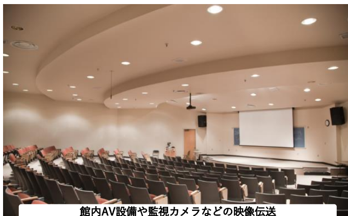
館内AV設備や監視カメラなどの映像伝送